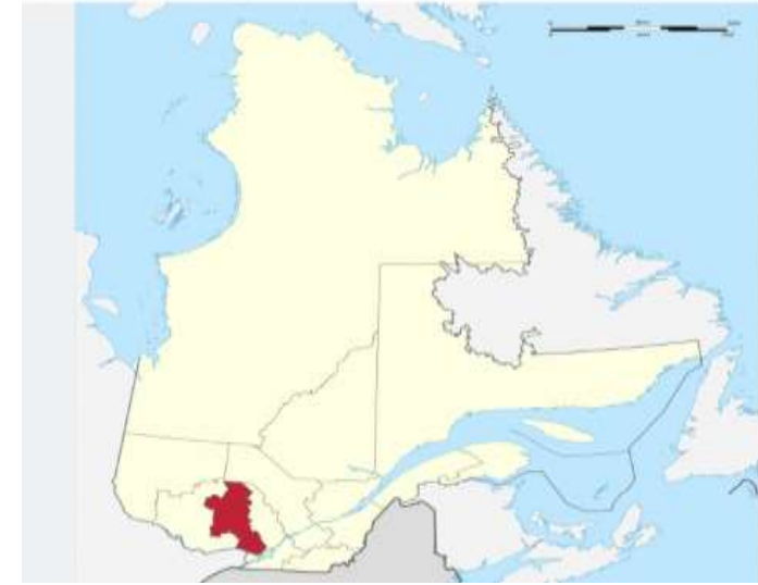
Population des MRC 1 de la région des Laurentides, projections pour 2022